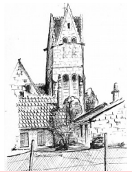
Clocher de l'église St Léger Michel FORTIN 1994

Association régie par la loi du 1er juillet 1901 et le décret du 16 août 1901 – n° W604004003 Siège social : Mairie 60123 ÉMÉVILLE – Courrier : 7 rue des Brandons 60123 ÉMÉVILLE Tél. 03 44 88 56 58 – Courriel : ahe@orange.fr – Site internet : assohistemeville.jimdo.com Reconnue organisme d'intérêt général à caractère culturel.