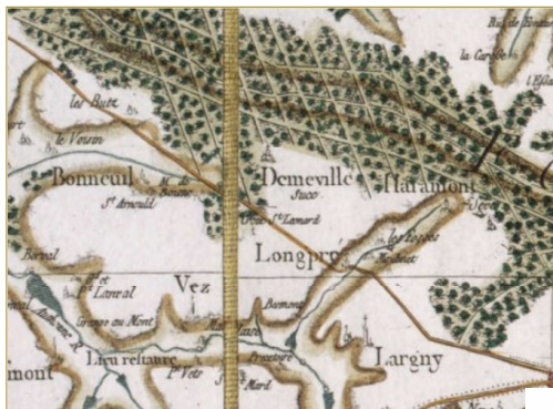
Carte CASSINI – DEMEVILLE en 1670